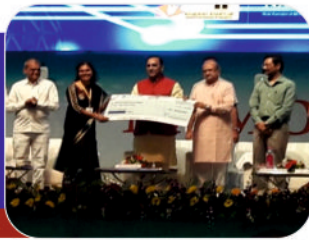
Matching Grant of Rs. 1.2 Crore Under SSIP, Govt. of Gujarat, 2017