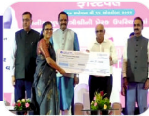
Matching Grant of Rs. 2 Crore Under SSIP, Govt. of Gujarat, 2022

MoUs with 32 Pharma Industries & Hospitals